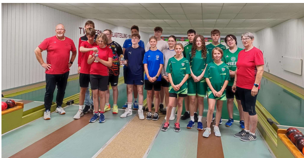
<- Turnier 2024

Nun hieß es weiter dran zu bleiben, um weitere Jugendliche nachhaltig zu gewinnen. Dieses Turnier wird künftig im Rahmen unseres TV Sommerfestes wiederholt.